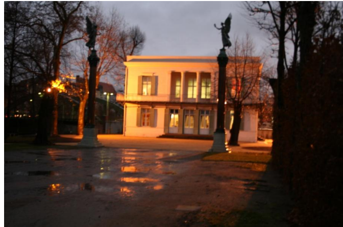
Schinkelpavillon am Abend des 3. Dezember 2011

Mit wenigen, aber qualitativ äußerst hochstehenden Maßnahmen ist es gelungen, sowohl den originalen Wohncharakter den Besuchern nahezubringen als auch den wertvollen Kunstobjekten eine äußerst ansprechende und ganz einfach passende Umgebung zu bieten. In engster Zusammenarbeit mit Frau Hein, SPSPG wurden alle Gewebe auf der Grundlage des Gabain-Musterbuches und der vorhandenen Unterlagen durch uns produziert und geliefert, sowohl der „Schinkelrips“ (Se/Co) in blau und gelb, beide Farben äußerst intensiv durch Garbfärbung und optimale Dichtenverhältnisse als auch die passenden Bordüren, die auf unserem Breitwebstuhl weitestgehend originalgetreu wiederhergestellt worden.