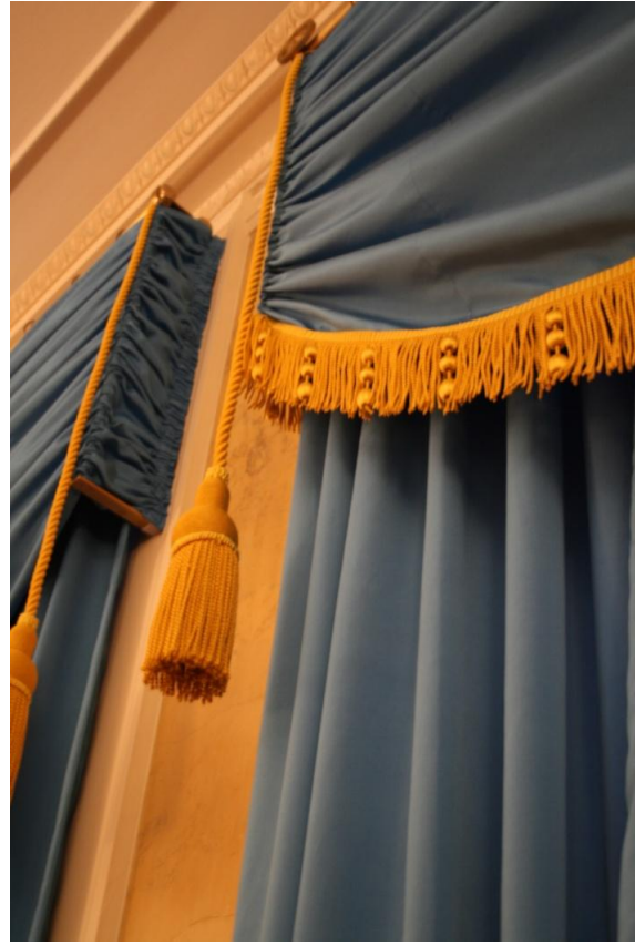
Bordüren und Posamente

Erstmals in der seit 1966 andauernden Zeit unserer Lieferungen an die Potsdamer Schlösser wurde auch ein Wollstoff, der intensiv rote Wollstoff für die Eckbänke durch uns produziert und geliefert.