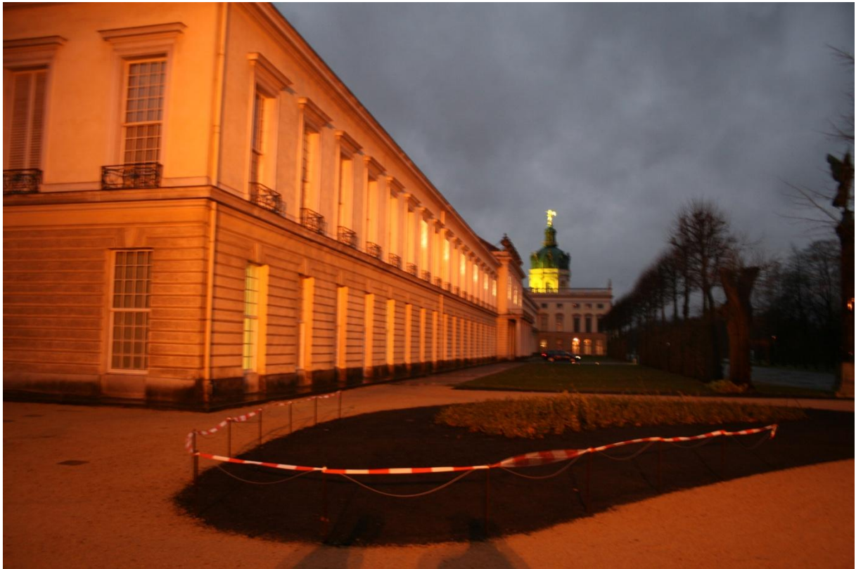
Schloß Charlottenburg am Abend des 3. Dezember 2011

Schinkelpavillon – oder auch Neuer Pavillon am Schloss Charlottenburg