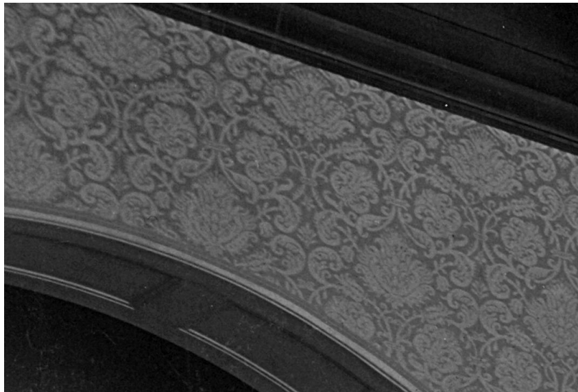
Originalfoto vergrößert und geschärft

Uns kam die ehrenvolle Aufgabe zu, die Wandbespannung von 1905 zu rekonstruieren. Diese Aufgabe glich einer Odyssee, nur mit glücklicherem Ausgang. Nachdem durch gute historische Quellenlage die historischen Fotos ausgewertet wurden, fand sich zusätzlich in der Festzeitschrift der Hinweis auf: seidene Wandbespannung.