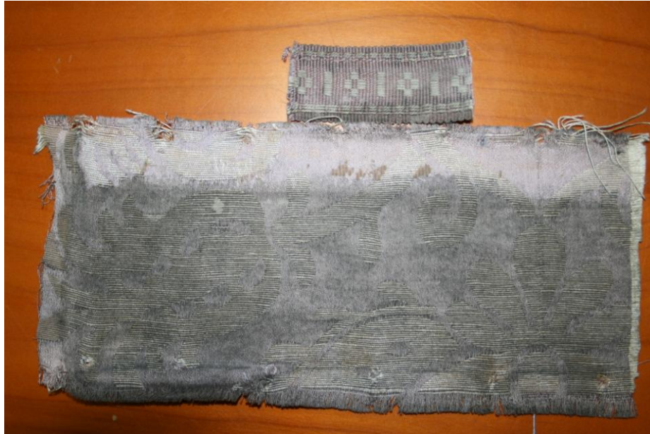
Original mit Originalborte

Die Überraschung war groß, als bei den Restaurierungsarbeiten der Wandvertäfelung am Klingerbild hinter der Verkleidung nun doch ein Originalstück und die Originalborte gefunden wurde. Der Befund brachte die Wahrheit ans Licht – in der Festzeitschrift wurde „geschummelt“, es war Baumwolle/Leinen. Zugegebenermaßen eine sehr gut, seidig schimmernde Baumwolle. Auf Grund des Befundes konnten nun verwendete Materialien, Feinheiten, Dichten, Bindungskonstruktionen und die Handschrift des Künstlers ersehen werden – und aus dem Teilstück auf den gesamten, etwas 10mal so großen Rapport geschlußfolgert werden. Die größte Überraschung aber waren die Farben. Das vom Schmutz gesäuberte Violett war nahezu identisch mit der von der Innenarchitektin vor Originalfund bestimmten Farbe. Aus dem gleichen Material wurde dann die Borte von unserem Partnerunternehmen innerhalb der ALLIANZ TEXTILES DENKMAL, der Posamentenmanufaktur Forst originalgetreu nachgewebt.