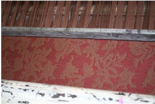
Auf der Webmaschine

Nahtlos in den Gesamteindruck reiht sich auch die nach Original erfolgte Rekonstruktion der Möbel-Bezugsstoffe in Wolle/Baumwolle ein. Hier bestand die Schwierigkeit im Finden des richtigen Farbtone, da die Originale stark verblichen und verschmutzt waren.