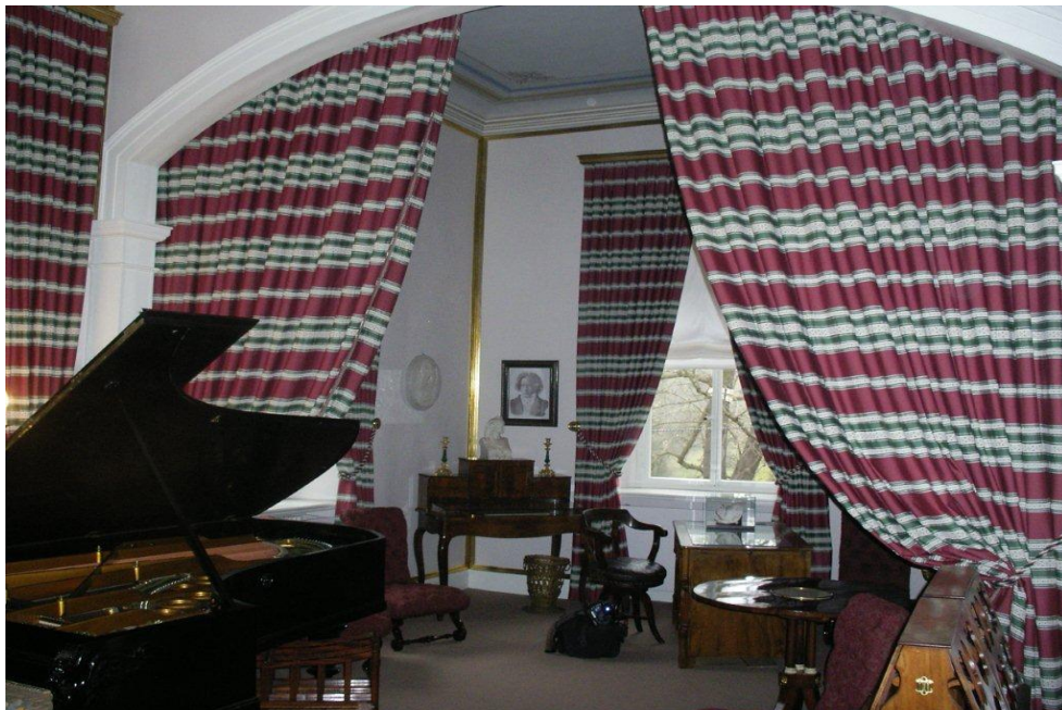
Nach der Rekonstruktion 2011