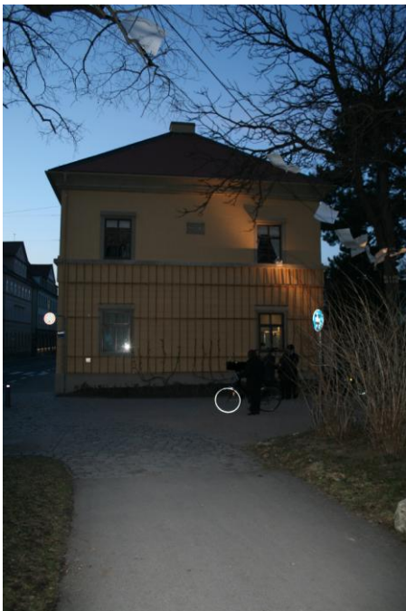
Liszt-Haus am Abend der Wiedereröffnung

Am 21. März war es so weit! Nach über einjähriger Bauzeit wurde das – lange vernachlässigte – LISZT-Haus – außen und innen renoviert, restauriert und rekonstruiert, wieder eröffnet.